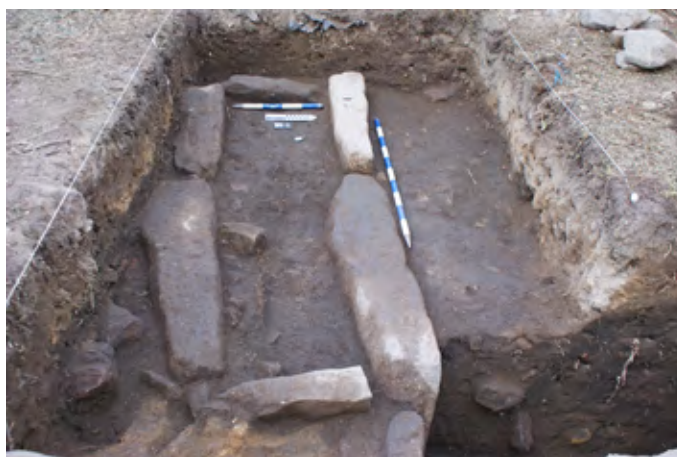
Figura 4. Sepultura de lajas de granito exhumada en el sondeo 1.

El sondeo 2, se situó en la parte este de la parcela (fig. 8), y contó con unas dimensiones de 6,28 m 2 . La secuencia estratigráfica en esta cata estaba menos alterada que en el sondeo 1. Bajo la cubierta vegetal se localizó un sedimento orgánico de entre 20 y 40 cm, que cubría el afloramiento rocoso granítico. Durante la limpieza del sustrato, se documentó, parcialmente, el corte de una sepultura antropomorfa, sin restos óseos. Su orientación era, como en la cata 1, E-O, con el rebaje correspondiente a la cabeza, ubicado en la