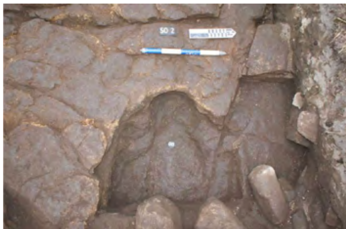
Figura 5. Estructura antropomorfa documentada en el yacimiento de A Capela.

parte oriental de la sepultura (fig. 5). Cubría el corte un depósito de piedras de tamaño medio y cascajo, en el que se documentaron algunas cerámicas de pasta gris con incisiones (zigzags y línea curva). Estas decoraciones aparecen representadas con frecuencia entre las diferentes tipologías cerámicas. En Galicia, algunos motivos similares se localizaron, por ejemplo, en Cova Eirós, donde las dataciones radiocarbónicas de los contextos estratigráficos asociados han proporcionado fechas entre los siglos X y XI d. C. (Vila, de Lombera, Fábregas y Rodríguez-Álvarez, 2018, p. 99).