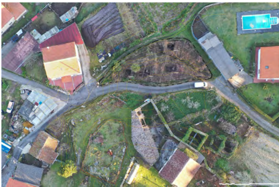
Figura 10. Vista cenital del yacimiento de A Capela tras finalizar la intervención arqueológica. Abajo, a la izquierda, restos de una estructura conservada en la aldea de San Salvador.

suroeste de la finca (fig. 10). Esa zona no ha sido objeto de una actuación que permita ratificar o desechar dicha tesis.