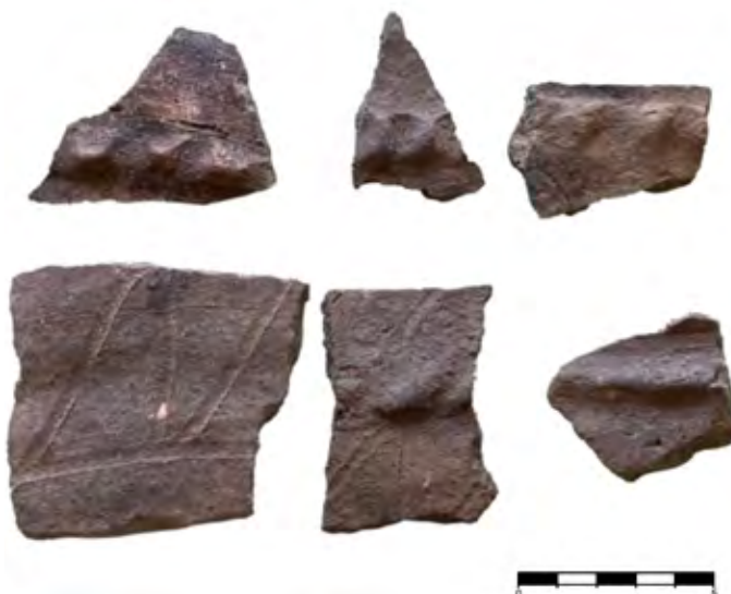
Figura 7. Fragmentos de cerámicas grises recuperados durante la excavación del sondeo 4 (elaboración propia).

Además de tratarse del sondeo con mayor presencia de restos materiales (en total, 315 números de inventario, incluyendo tejas curvas, cerámica gris, restos líticos y un elemento metálico), por debajo del nivel arqueológicamente fértil se documentó una estructura configurada con un murete perimetral y una base plana configurada con losas. Sus dimensiones (1,22 m de largo x 0,86 m de ancho) están incompletas, puesto que la estructura se extiende bajo la superficie no excavada (fig. 8). En cuanto a su interpretación, la ausencia de restos relacionados directamente con la estructura dificulta su comprensión, si bien, teniendo en cuenta las evidencias documentadas en el yacimiento, y su propia tipología, puede avanzarse que podría tratarse de una estructura funeraria de base pétrea, que contaba con un muro perimetral y estaba tapada con lasjas. Dadas sus dimensiones, es posible que se tratase de un enterramiento de carácter colectivo, sobre el cual no pueden establecerse precisiones cronológicas con la información disponible, puesto que no se localizaron materiales asociados directamente con esta estructura, que se apoya directamente sobre un depósito natural de granito meteorizado.