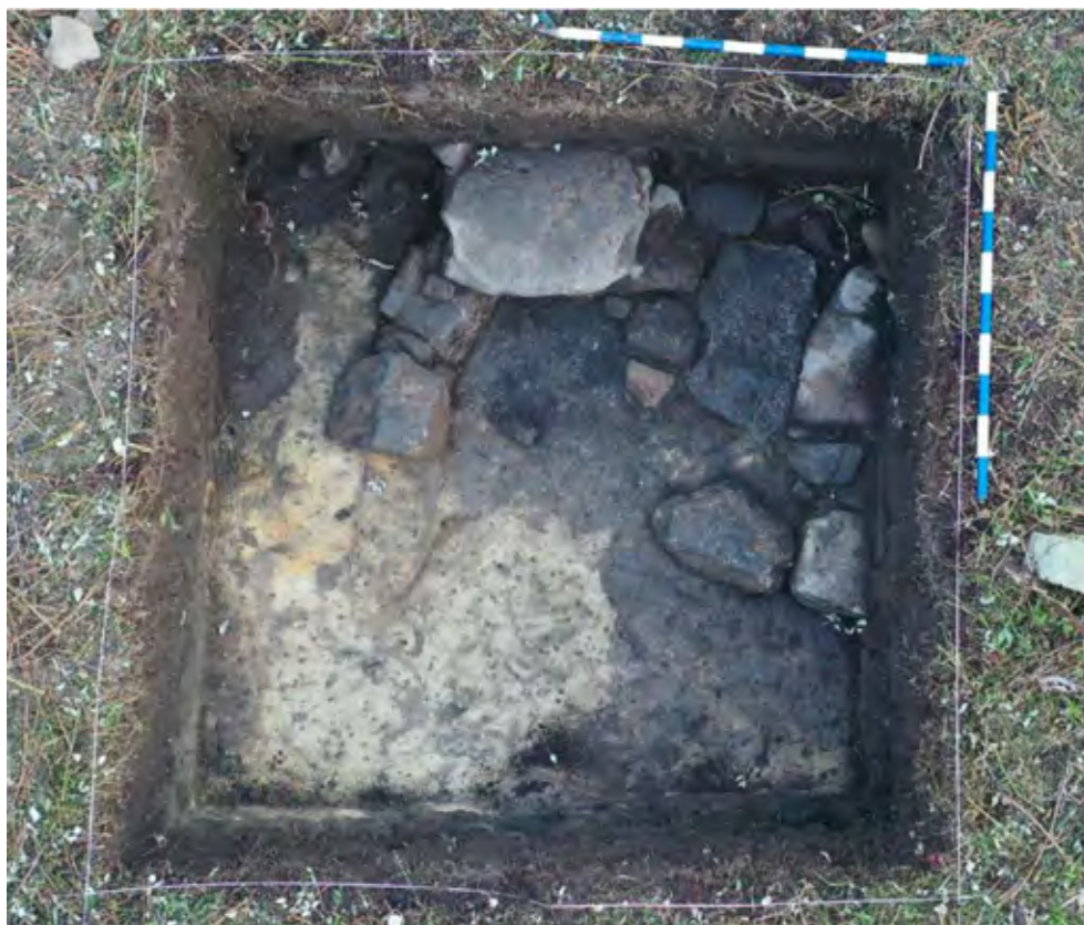
Figura 8. Vista de la estructura documentada en el sondeo 4, una vez localizado el sustrato geológico.