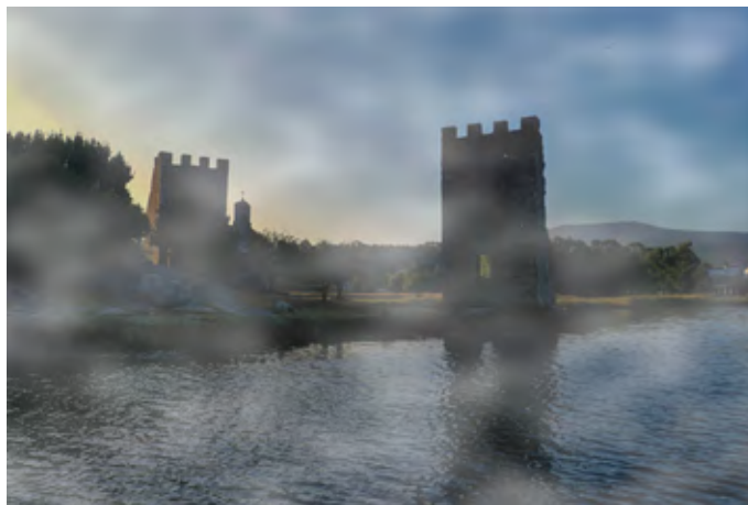
Figura 1. Vista actual de las Torres de Oeste, desde el río Ulla.

Dicho yacimiento oculta, no obstante, una riqueza mucho mayor, debida a la presencia de ocupaciones anteriores que encuentran su justificación en la privilegiada situación de este enclave (Naveiro, 1990; 1992; 2002). Se encuentra en la parte más estrecha del río, en una vía de penetración natural hacia el interior de Galicia (fig. 2). Eso explica que en las actuaciones arqueológicas desarrolladas en el yacimiento en los años 1950-1951 (Chamoso, 1951), 1970-1973 (Balil, 1970; 1977), 1989 (Naveiro, 2004) y 2011, (Hervés, 2011), se haya documentado una prolongada ocupación del solar en el cual hoy se alzan las Torres de Oeste, que se remonta a la Edad del Hierro (Piay y Naveiro, 2023, pp. 73-83). Al asentamiento prehistórico siguió uno de época romana, que debe interpretarse como un establecimiento portuario de cierta importancia, canalizador de las mercancías dentro del importante nudo de comunicaciones que constituye el área de Iria Flavia (Naveiro, 2004, p. 122). Los restos cerámicos apuntan a