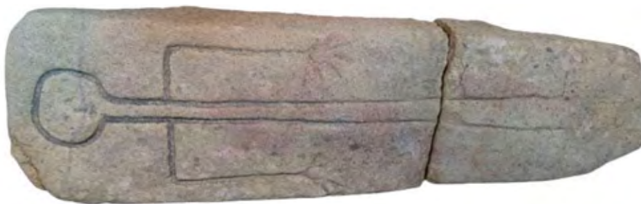
Figura 3. Lauda sepulcral documentada en el año 1966 en la finca de «A Capela».

La superficie excavada ascendió a 24 m 2 , distribuida entre cuatro sondeos manuales (fig. 8). Puesto que la parcela presenta un notable desnivel entre su parte norte y su parte sur, se plantearon 3 sondeos en la primera y uno en la segunda. Además, se limpió un corte en la parte noroeste de la parcela, en el cual los vecinos aseguraban que se había extraído, en el año 2004, una lauda antropomorfa de una sepultura infantil (fig. 3). Dicha lauda, elaborada en granito, se conserva actualmente en el Museo de Pontevedra, y cuenta con unas dimensiones de 1,40 m x 0,43 m.