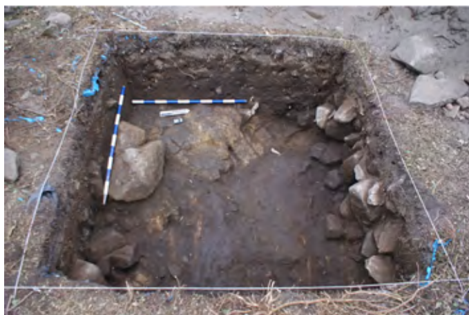
Figura 6. Foto final del sondeo 3, desde el este. La excavación se detuvo al documentar restos de dos inhumaciones.

En esta cata se documentó, una vez retirada la cubierta vegetal y el nivel de tierra orgánica, un depósito fértil, sin intrusiones, en el que se localizaron numerosos fragmentos cerámicos de pasta gris (fig. 8), muchos de ellos con decoración incisa (acanaladuras, líneas oblicuas y en zigzag), y otros con decoración plástica (cordones y mamelones), que encuentran, en Galicia, paralelos en el yacimiento de As Pereiras (siglos VIII-XI) y en el castillo de Portomeiro, en el cual se datan en el siglo X decoraciones con cordones digitales, además de piezas con incisiones cortas y oblicuas (Alonso, 2021, pp. 779-781).